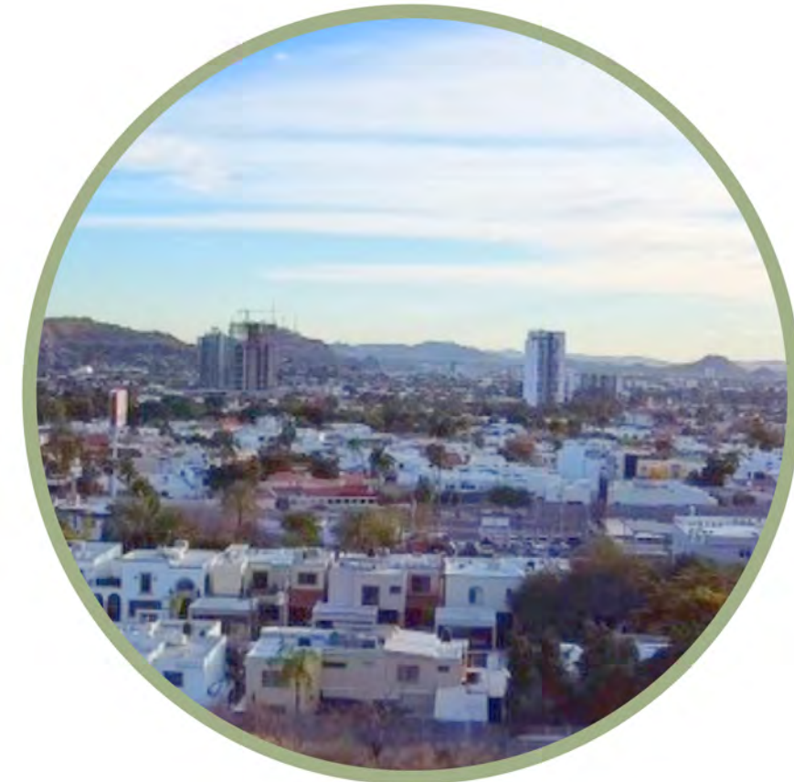
VISTA A LA CIUDAD