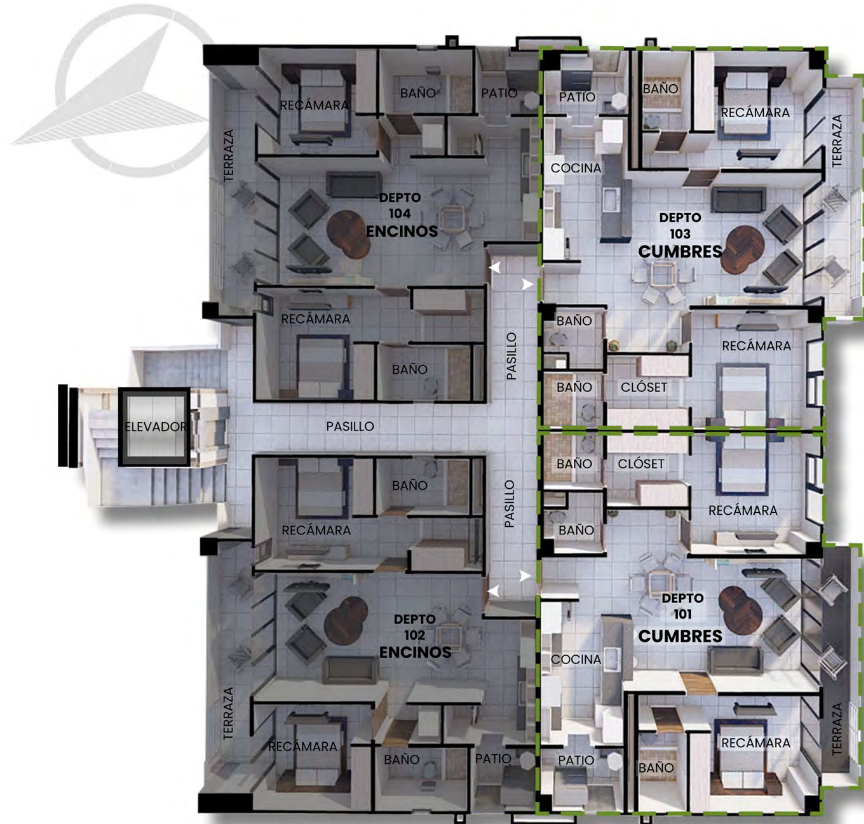
PLANTA ARQUITECTÓNICA TIPO PARA NIVEL 1, 2, 3 Y 4